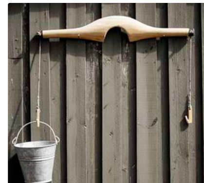
Her er eit «vassel» eller «vassåk» som ein brukte til å bera vatn med.

– Tenk alt me bruker reint drikkevatt till! Og folk andre stadar i verda må gå langt for å få seg noko å drikka, seier ho. – Ja, me har mykje å vera takksame for!