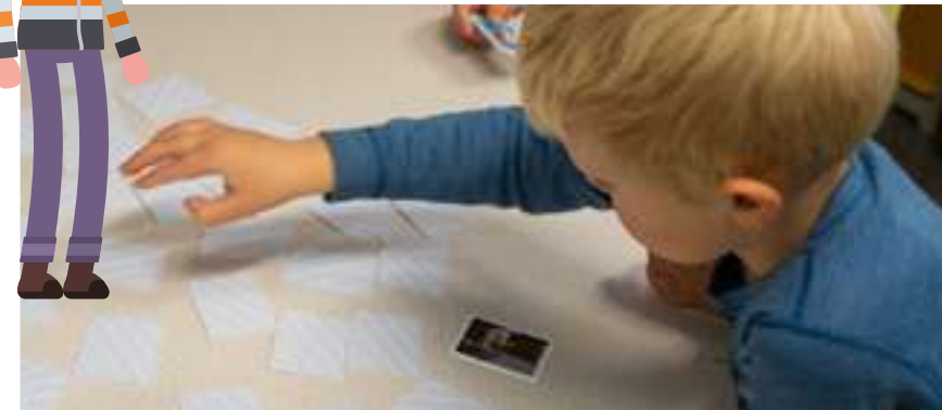
Kor var det no det andre kortet låg?