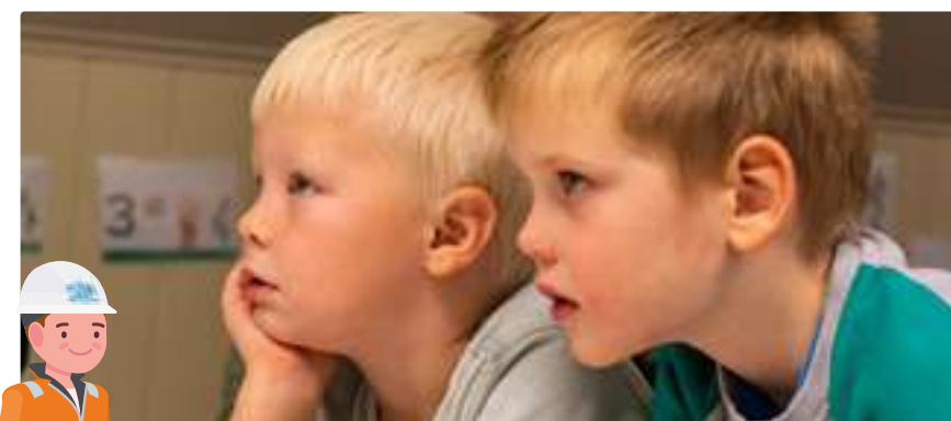
Spennande å sjå kva den blå kofferten inneheld og bli kjende med Vassbjørn i BVA!