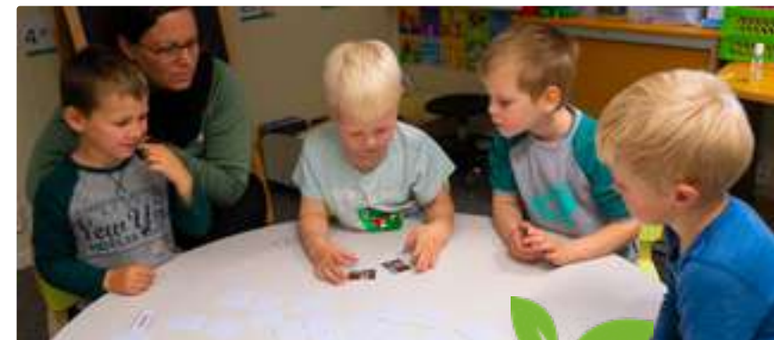
Yess - to like i hugaspelet!