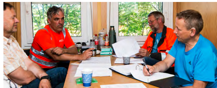
Frå byggemøte mellom BVA, kommune og entreprenør ved prosjektet ved Foldrøy skule.