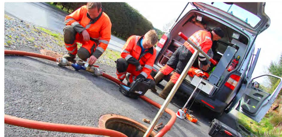
Lekkasjesøk med avansert utstyr er ein del av BVA sin beredskap. Me har overvaking av vassforsyninga 24 timar i døgeret, kvar dag, heile året.

Vatningsforbod sikrar difor at det er nok vatn i høgdebassenga ved brann og nok vasstrykk til dei abonnentane som bur høgt.